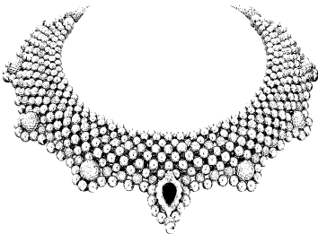
गुरुपुष्यामृत योग, सुवर्णालंकार